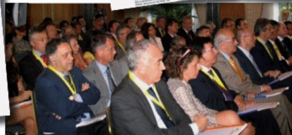
Il pubblico della presentazione del 25 maggio